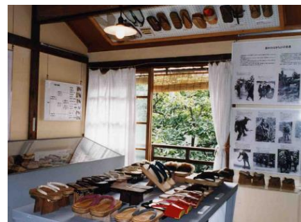
第4回 暮らしの中のはきもの