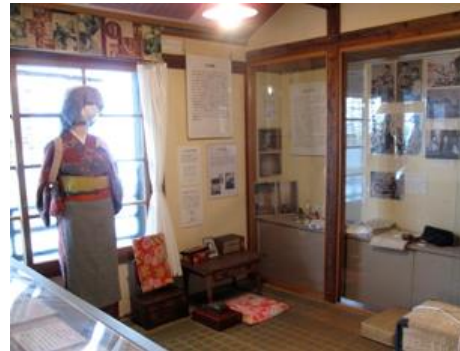
第10回 昭和、女中のいた時代