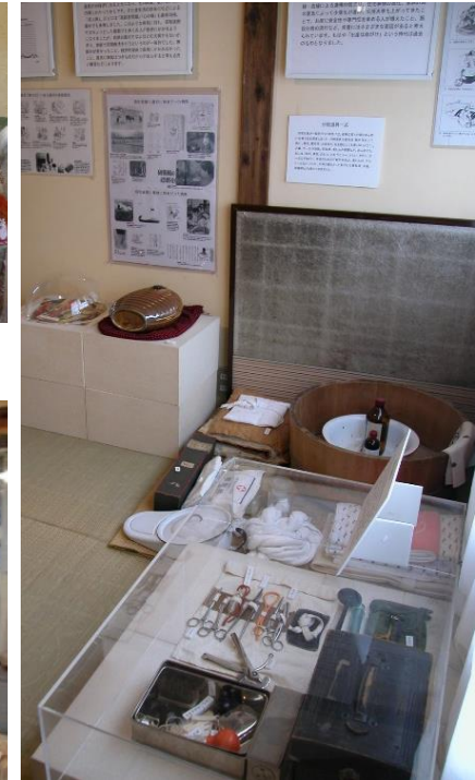
第8回家で病気を治した一家庭看護の時代