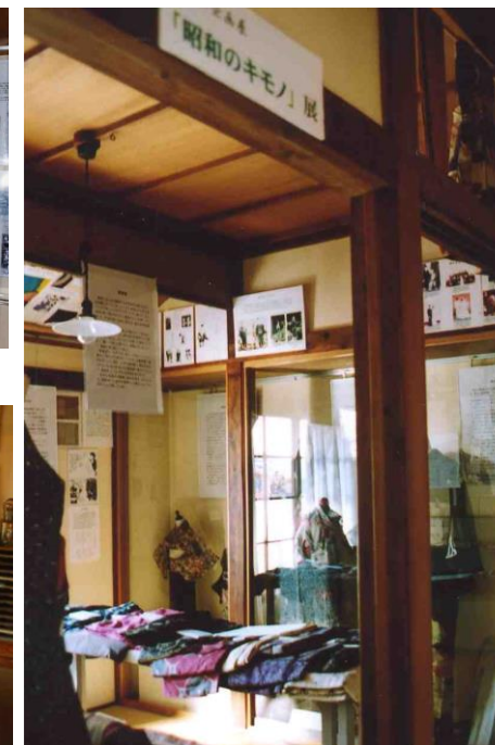
第6回 昭和のキモノ