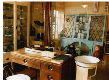
第5回 町のお医者さん