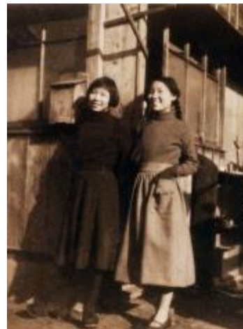
第11回 少女たちの昭和